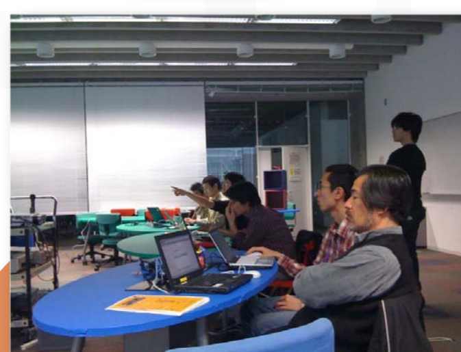
参加者の理解度に合わせて進行