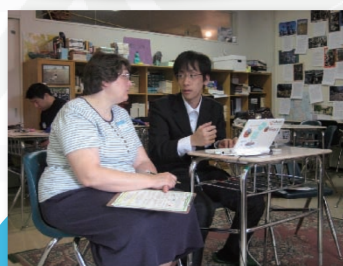
Moodleについて、参加者一人一人に説明