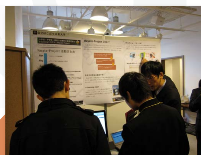
学生審査員にプロジェクトの説明