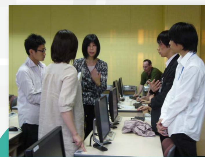
参加者の方々の質問に個別に回答