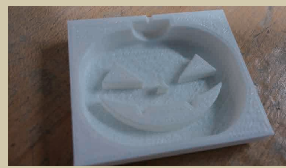
▲ハロウィーンキャンドル制作ワークショップ