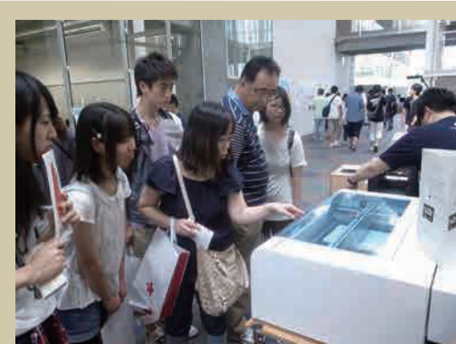
▲オープンキャンパス