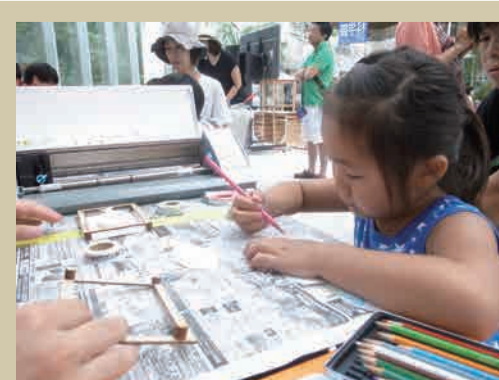
▲はこだて国際科学祭