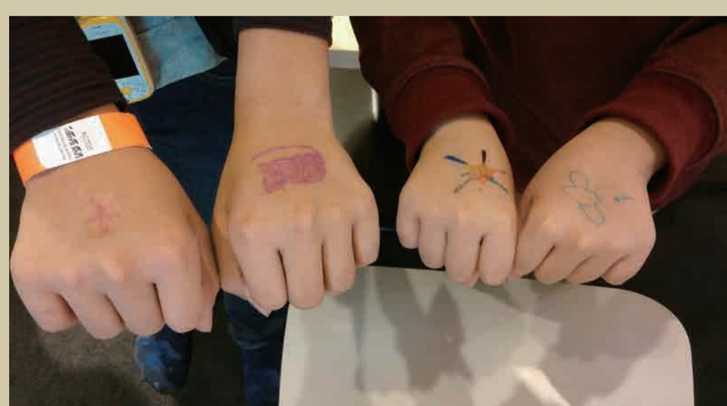
▲ボディシール制作ワークショップ