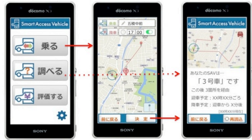
図2: ユーザ App 画面の遷移

(c) 降車希望時刻を指定(オプション)。鉄道や航空機への接続などの締め切り時刻を指定する。