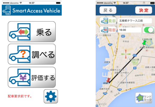
図3: 第2回実験に用いたユーザ App の画面 (左はホーム、右はリクエスト中)

車載 App (図4) では、乗車 (赤) と降車 (緑) を色分けし、地図上の地点表示との対応付けが容易になるようにした。また左端に「休憩」「呼び出し」のボタンを配置した。ドライバからの「休憩」リクエストが入ると配車システムはその SAV に新たなデマンドを割り付けない。乗車中の乗客がすべて降車した時点でドライバは休憩に入れる。休憩モードに入るとこのボタンは「運行開始」に変わる。つまり、有効なボタンだけを表示 *6 するようにした。「呼び出し」は乗客が見つからないなどのトラブルのときに配車センターに連絡するためのボタンである。