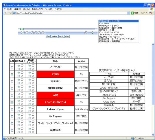
図 2: 提示されるプレイリストの例