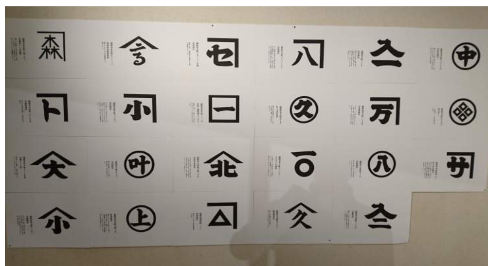
壁面制作1：屋号パネル