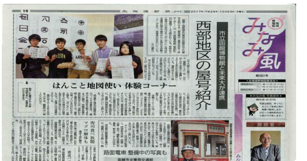
新聞に掲載されました！