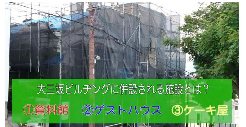
問題3：ビルディングに併設される施設は？