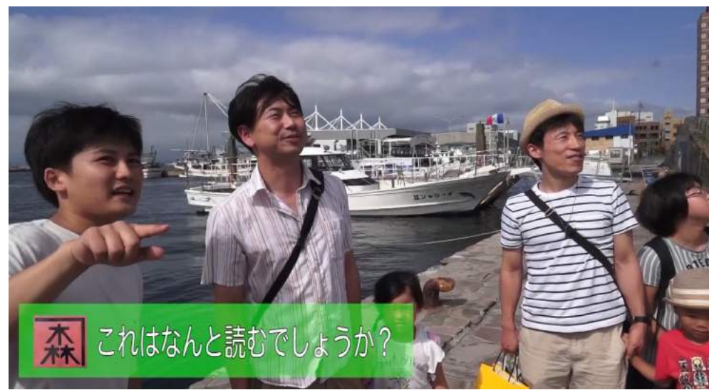
一般の方に問題出題！！