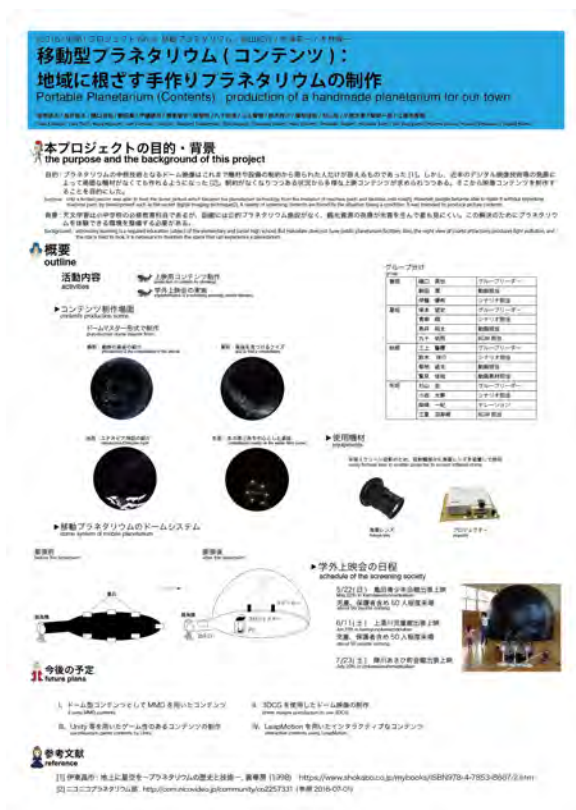
図 3.1 メインポスター