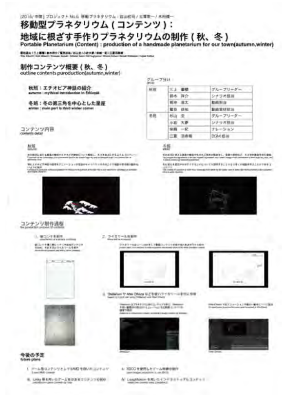
図 3.3 サブポスター (秋・冬)