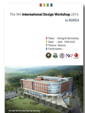
参加するワークショップのポスター

In our project, we will participate design workshop at Korea in Summer vacation. So, we practice English. The purpose is using English smoothly when we talk to foreign people. It is important to learn English in order to communicate while different culture. Also, if we communicate while different culture, we can know other country sence.