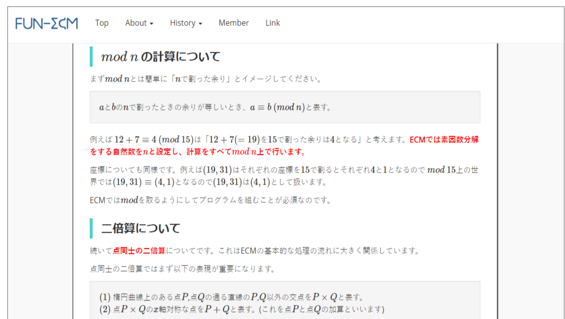
ECMの基礎理論解説ページ

ECMの解説ページでは中間・最終発表で紹介した基礎的なECMの理論について解説しています。時間の制限される発表に比べ、解説をより詳細にし、多くのことを理解できるようにしました。