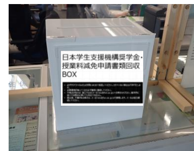
提出ボックスがあります