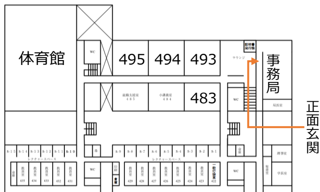
校舎4階 (3階正面玄関入って右の階段登る)

✓ 窓口で手続に関する質問を頂いても対応できません。事前にメール stu@fun.ac.jp にて 疑問を解消 してください。