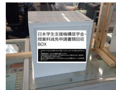
提出ボックスがあります