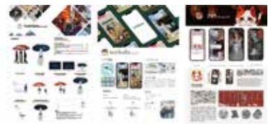
nokosu アップデート後（一部抜粋）