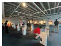
nokosu アップデート前（一部抜粋）

nokosu is a tool to record field survey data in the form of photos, comments, reactions, etc., to enable more efficient idea generation. This year, nokosu has been improved due to the lack of a save/share function, which was inconvenient when using the system, a difficult-to-understand UI design, and the fact that it is impossible to tell where a photo was taken.