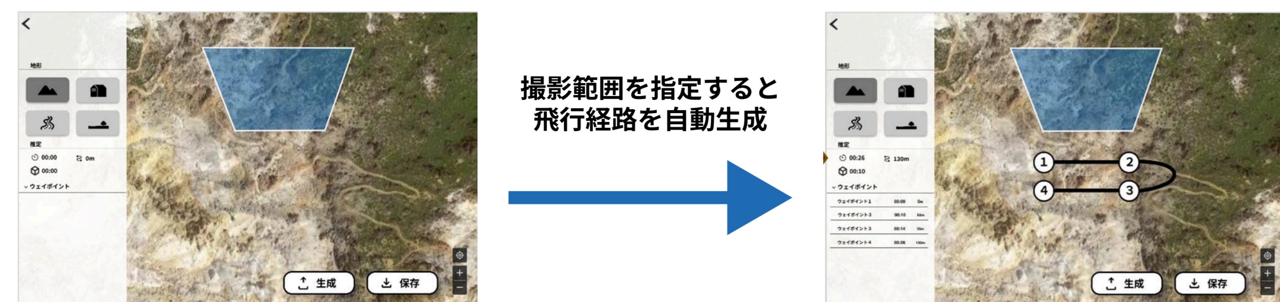
図3. 飛行経路を生成する機能

専用アプリケーションでタブレットに表示された地図上に調査したい範囲を指定するだけでドローンの飛行経路が自動で生成される。(図3)