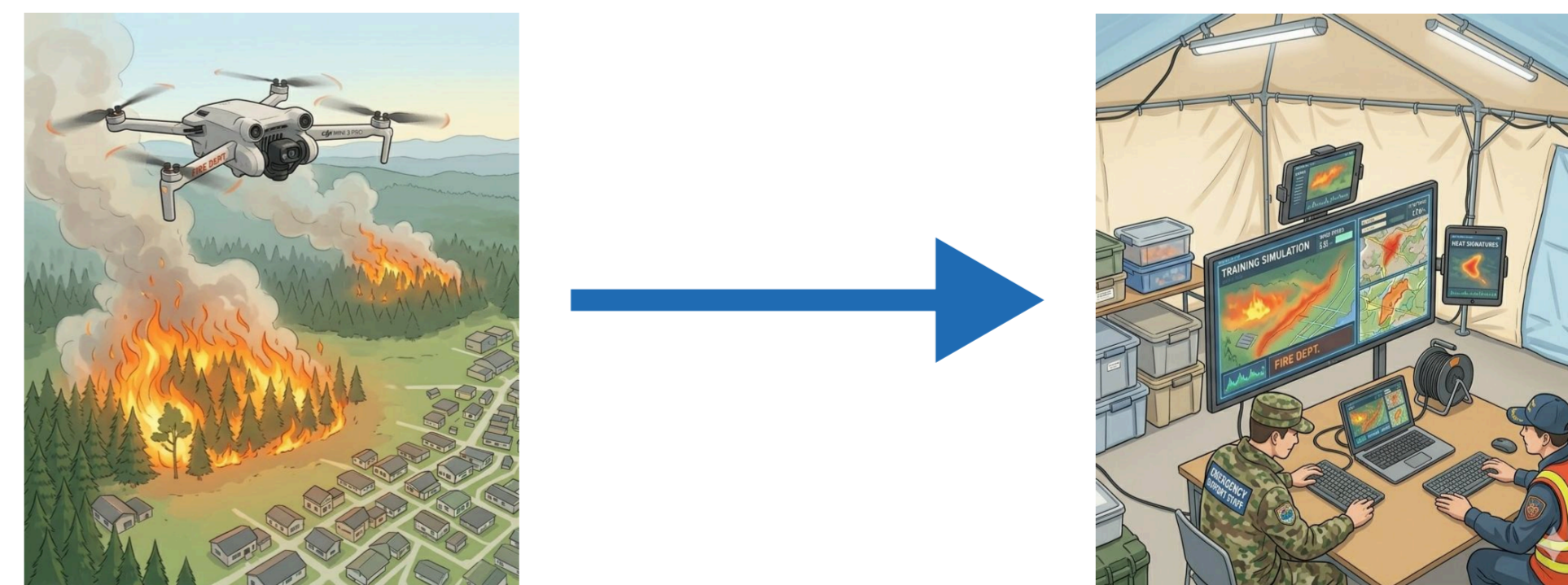
図6. 災害状況のリアルタイム伝送のイメージ

ドローンが捉えている高精細な映像を、クラウド経由で対策本部や関係者の端末へリアルタイム配信する。これにより3Dモデル生成を待つことなく、現在の災害状況や被害の推移を把握可能にする。(図6)