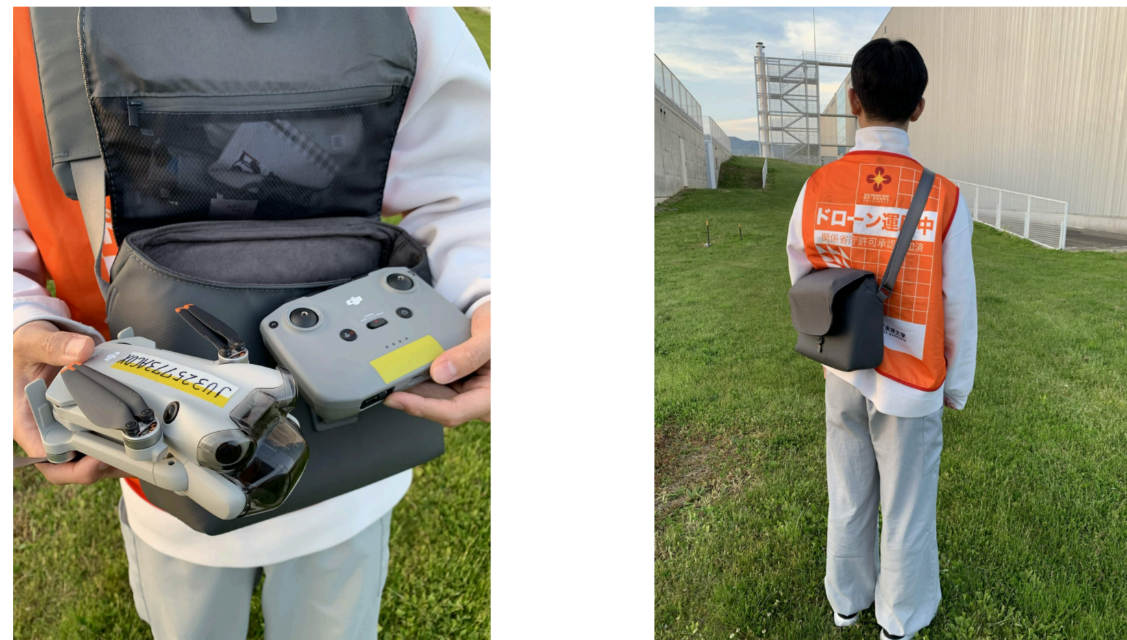
図2. システムを携帯している様子

軽量のDJI Mini 4 Proを採用することで、災害現場への持ち運びが容易である。本システム一式は約2kgと軽量で、A4サイズ程度のバッグで持ち運ぶことが可能である。(図2)