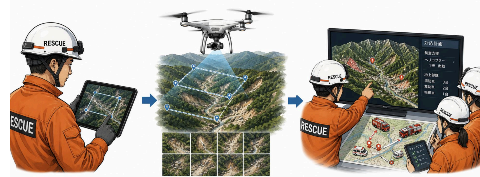
図4. ドローンの運用プロセスのイメージ

2025年8月に、北海道木古内町萩山の斜面を三次元化し、状況を迅速に確認した。現場到着から情報共有までに実際にかかった時間は、準備2分、経路生成2分、撮影3分、データ送信3分、三次元生成10分の合計20分だった。(図4)