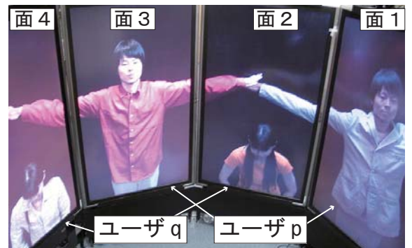
図 4: 過去を繰り返し重ね合わせた組み体操コンテンツ

4 のユーザ q の順で過去の様子を再生しながら体操に参加していく。過去の仮想共有面の記録を実際に再生し参照しながら演技を繰り返し追加することでコンテンツが充実していく。