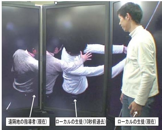
図 2: 10 秒前過去の重ね合わせによるゴルフレッスン