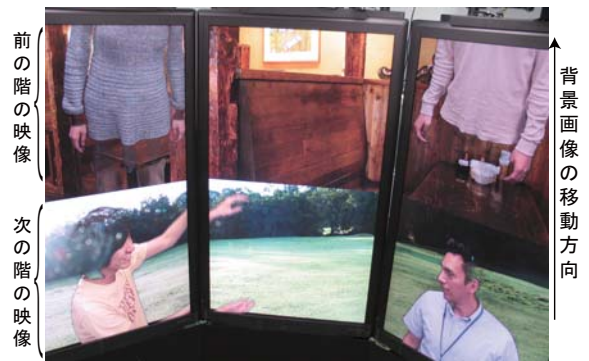
図 3: 下降するエレベータから見える風景を感じさせる背景の動き

遠隔地との同期的、非同期的コミュニケーションを区別なく操作できることを示すために、複数の過去の重ね合わせとコンテンツ部品化の機能を用いて組み体操コンテンツを作成した。楽曲制作における多重録音のように複数の過去を重ね合わせることで、t-Room 上でビデオコンテンツを作成することができる。図 4 は t-Room を用いて作成された組み体操コンテンツである。まず面 1 のユーザ p が体操をし、次に面 2 のユーザ q がその様子を再生しつつその体操に参加する。以下面 3 のユーザ p、面