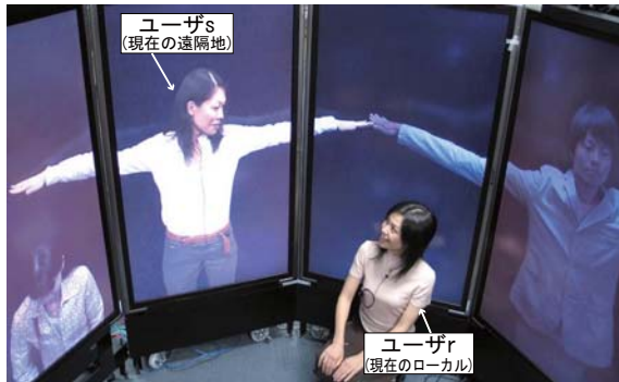
図 5: 組み体操コンテンツへの同期的な参加

機能を多数揃えるだけでは、ユーザがそれらの機能を理解したり柔軟に組み合わせて新たなアプリケーションを実現することが困難である。簡潔な機能を体系的に提供し、それらを容易に組み合わせる方式を見出す必要がある [8]。